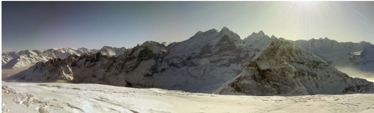
Die Sicht vom Wildgärstgipfel

Wir waren ganz allein in dieser reinen Landschaft, deren Beschreibung ohne dichterisches Talent müssig erscheint. Da es unterwegs relativ kalt war, machten wir nur kurze Pausen. Kurz vor dem Gipfel an der Sonne bei Wildstille wurde es aber überraschend warm. Dort gab es auch kaum Schnee also zogen wir die Skis ab und marschierten zu Fuss zum Gipfel, den wir in einer guten Zeit von 5 Stunden um 12:30 Uhr erreichten.